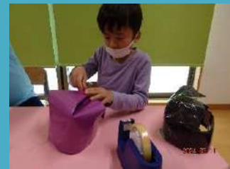
忍者頭巾を作ったよ！！