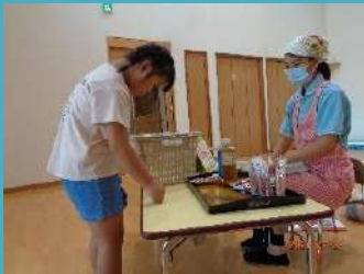
おにぎりクッキング