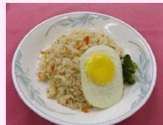
ナシゴレン (インドネシア風チャーハン)