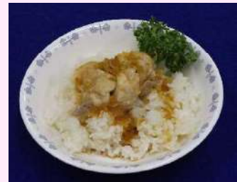
カオマンガイ(アジア風鶏飯)